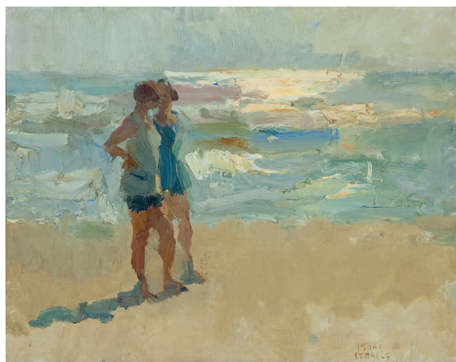
'Isaac' Lazarus Israels Twee baadsters op het strand, Viareggio

'Isaac' Lazarus Israels Amsterdam 1865-1934 Den Haag Het Lido van Venetië , doek 37,1 x 52,2 cm, gesigneerd. Herkomst: part. coll. Nederland. Lit.: vgl.: Antoon Erfteimeijer, Israels aan zee. Hollandse en Italiaanse strandtaferelen van Isaac Israels (1865-1934) , Haarlem 2007, pag. 64, afb. 90.