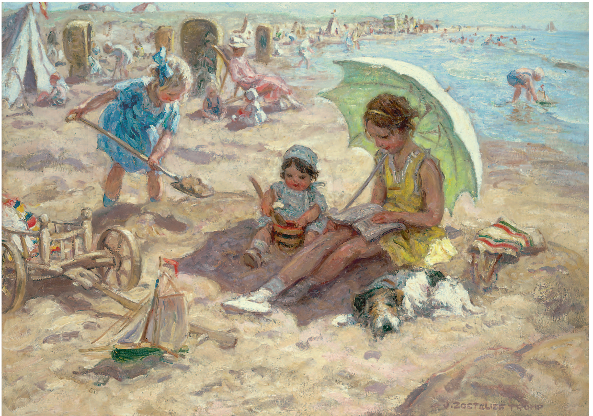
Johannes 'Jan' Zoetelief Tromp Spelende kinderen op het strand van Katwijk

'Leuk als pendant van de andere aquarel. Het is een snapshot vanuit dezelfde hoek van de Scheveningse boulevard.'