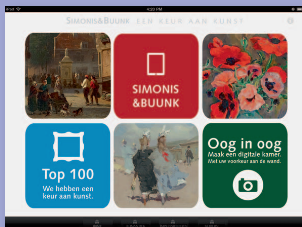
homepage van de app Keur&Kunst