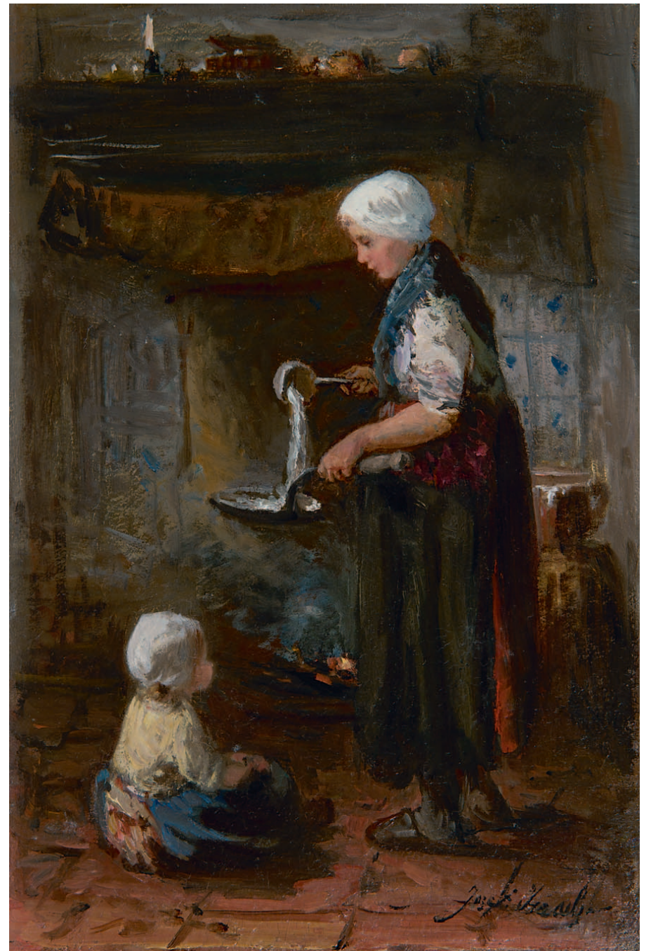
Jozef Israëls Pannenkoeken bakken

'Jozef Israëls is in zijn leven hoog gewaardeerd. Er is veel interesse vanuit Israël en de Joodse gemeenschap.'