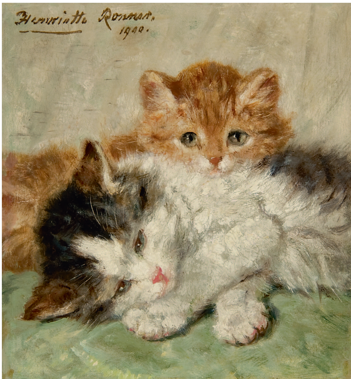
Henriëtte Ronner-Knip Doezelende kittens