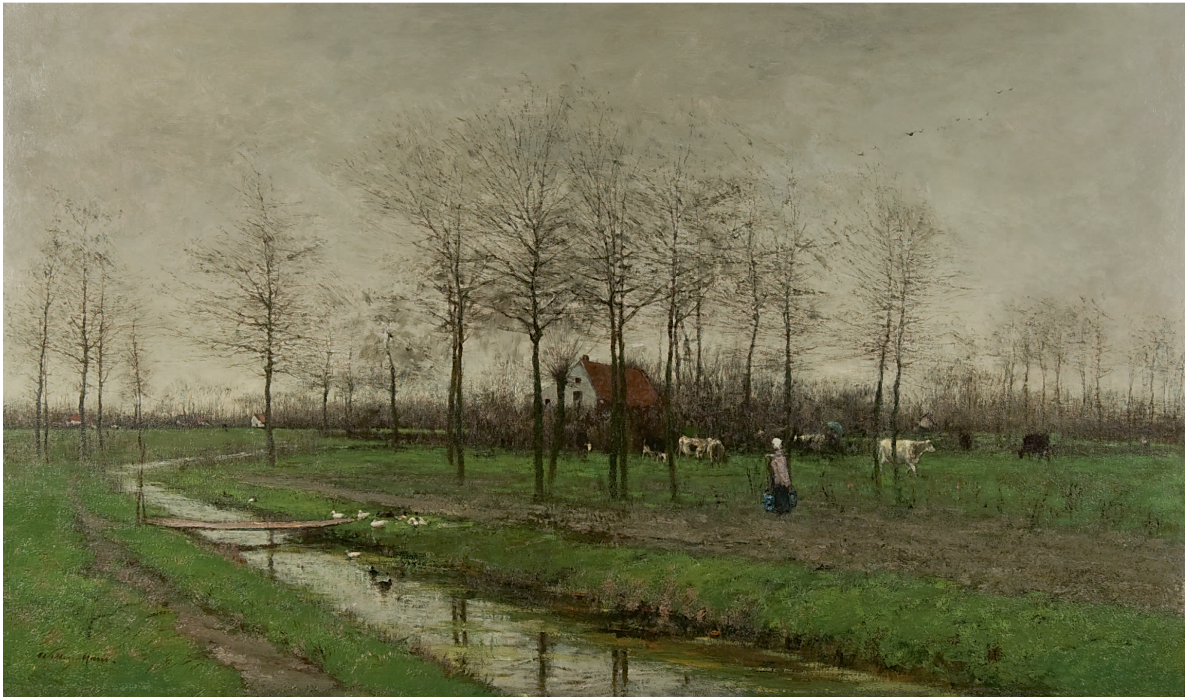
Willem Maris Vroeg in 't voorjaar