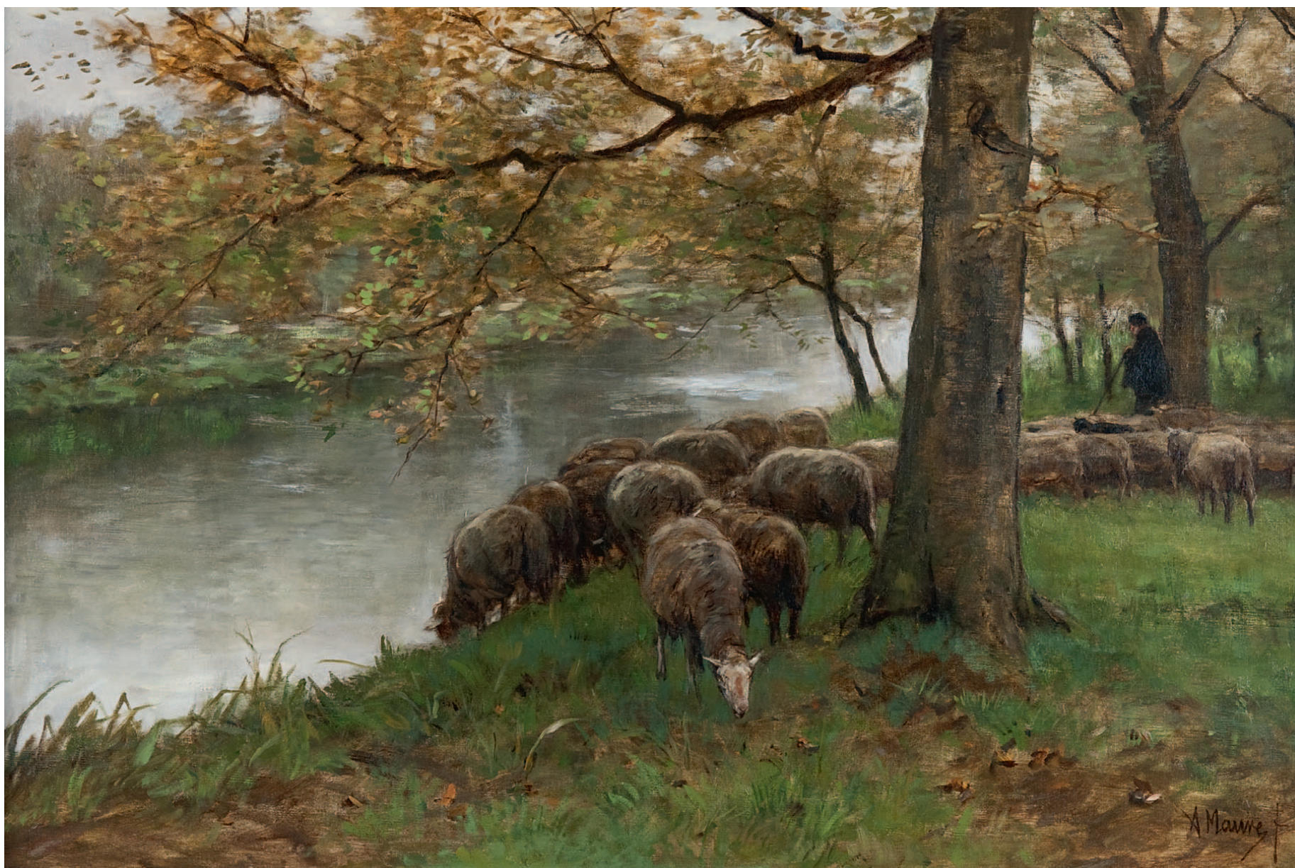
Anthonij 'Anton' Mauve Drinkende schapen bij een rivier

'Jozef Israëls is in zijn leven hoog gewaardeerd. Er is veel interesse vanuit Israël en de Joodse gemeenschap.'