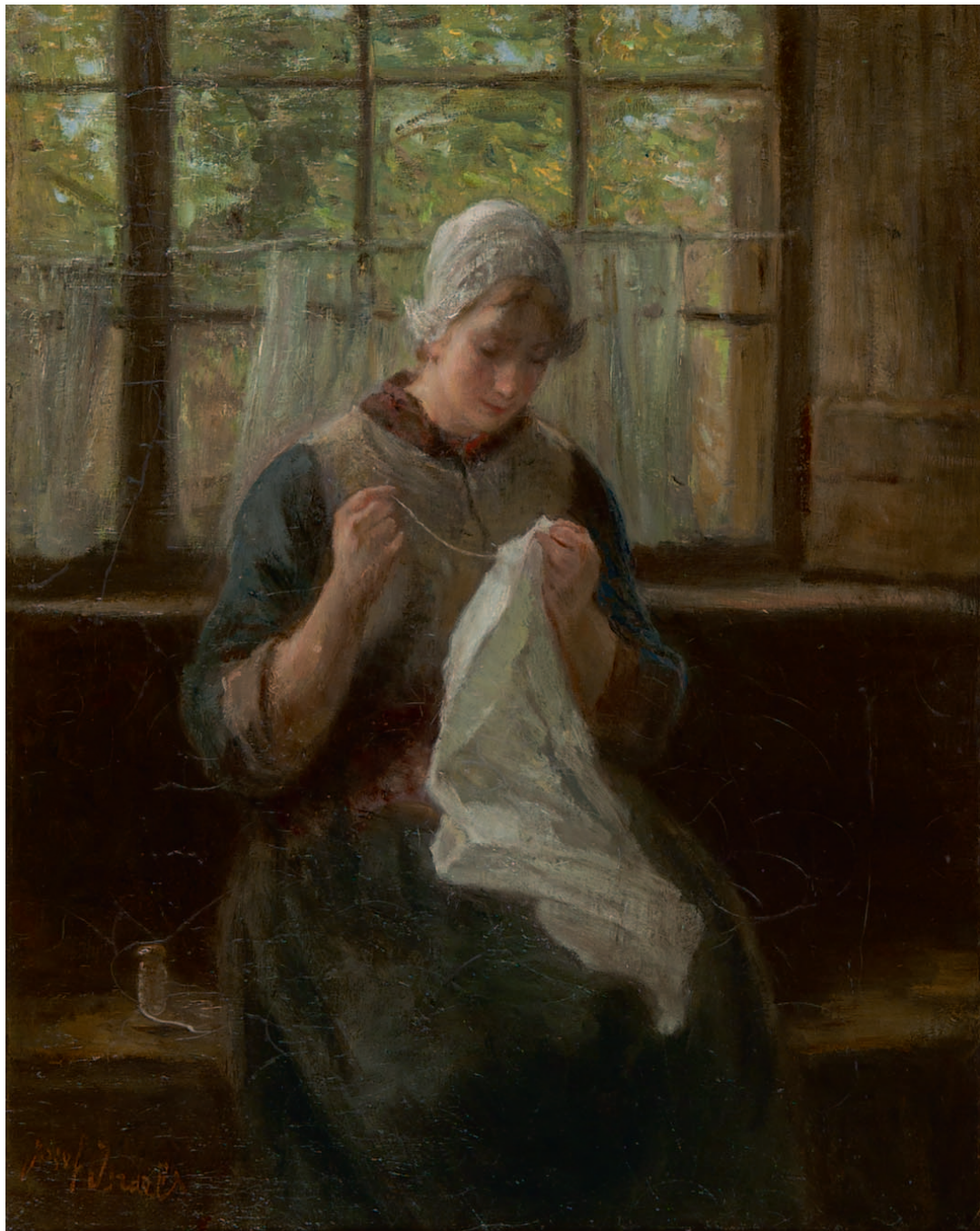
Jozef Israëls Handwerken bij het raam