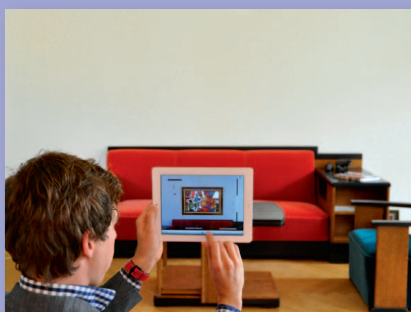
deel de digitale kamer via e-mail en sociale media