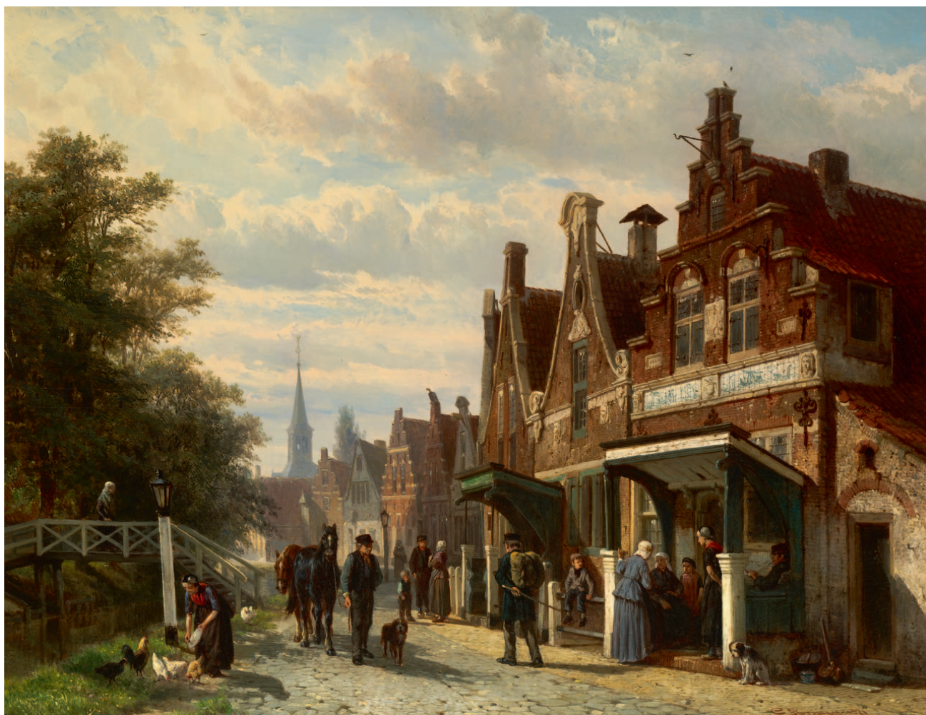
Cornelis Springer Fantasiegezicht op de Buren, Makkum

'De kroonprins van B.C. Koekkoek. Met een verstilld, maar toch mooi gestoffeerd bos.'