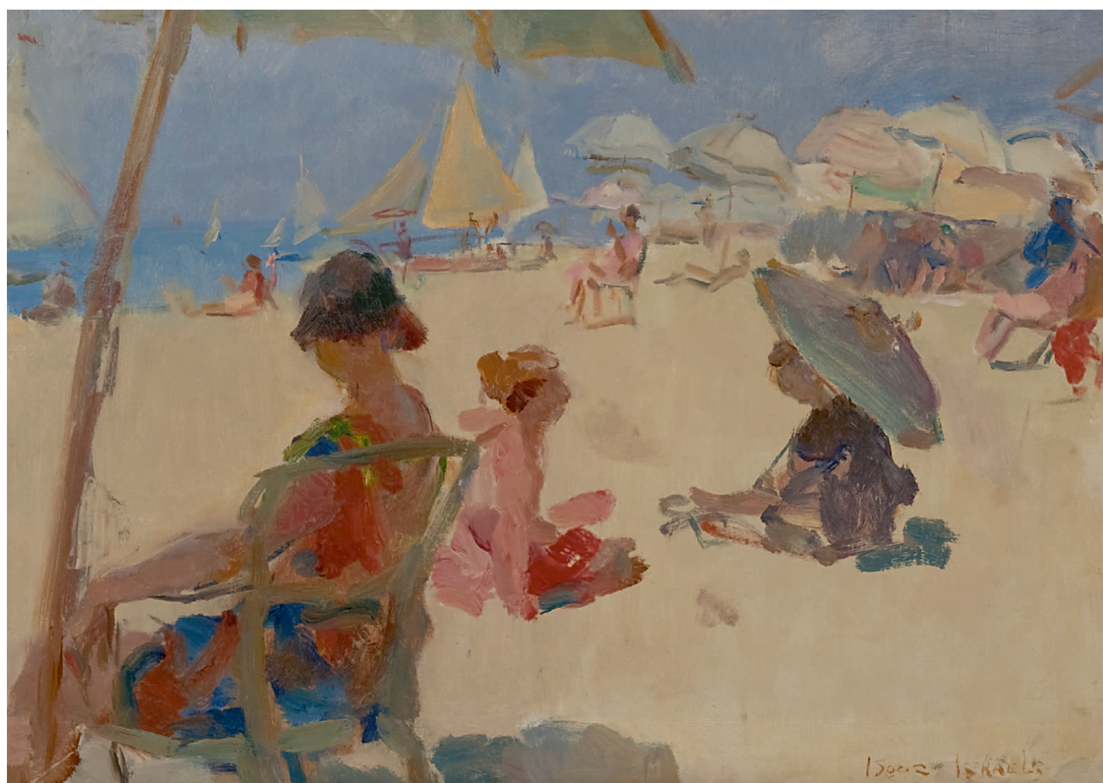
'Isaac' Lazarus Israels Het Lido van Venetië