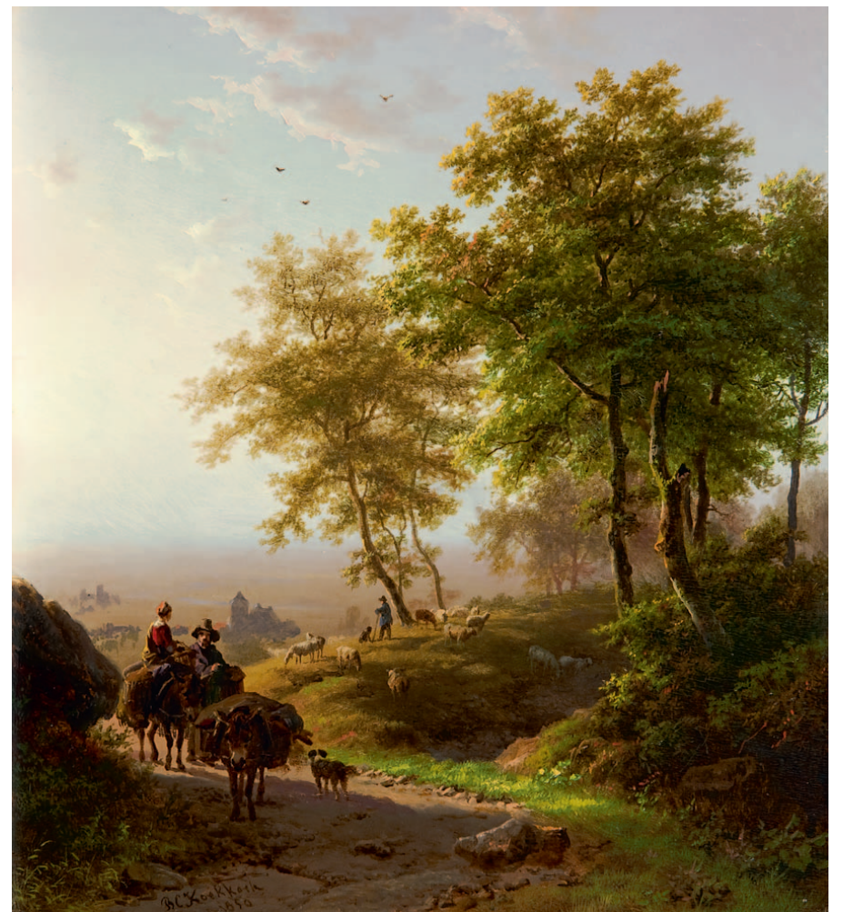
Barend Cornelis Koekkoek Boommrijk landschap bij morgenstond