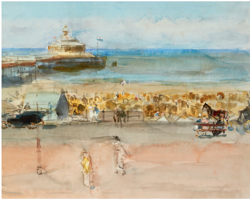
'Isaac' Lazarus Israels Een zonnige dag op de boulevard van Scheveningen